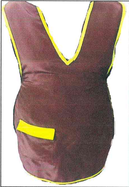
Nero con bordo verde